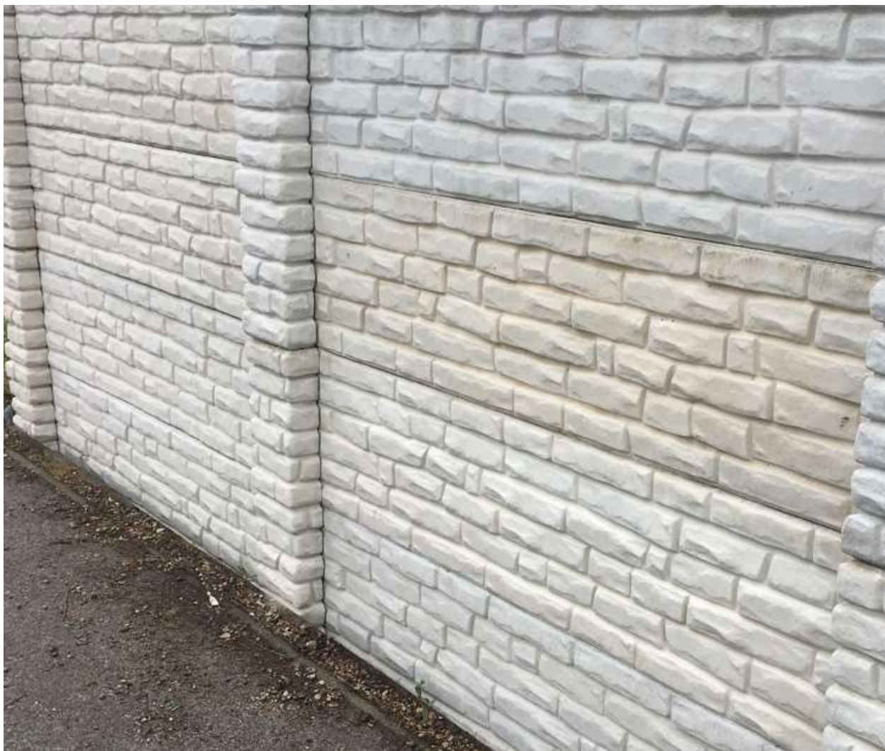
Obr. 4: Možné rozdiely odtieňov výrobkov spôsobené rozličným dátumom výroby a podmienkami zrenia