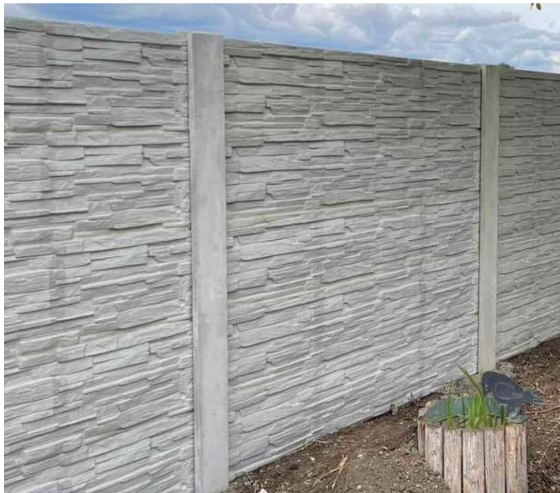
Obr. 3: Možné farebné odchýlky spôsobené oddeľovaním platní pri skladovaní / preprave